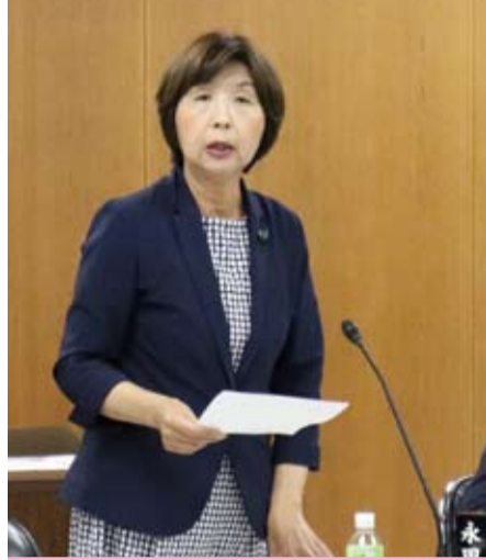
建設港湾委員会にて質疑

新 ・学習の習慣化や、意欲の向上のためタブレット端末を持ち帰り、家庭学習を実施(小・中学校 計26校でモデル実施)